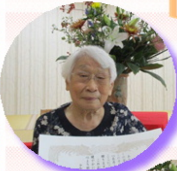
敬老会を行い、賀寿表彰をさせて頂きました