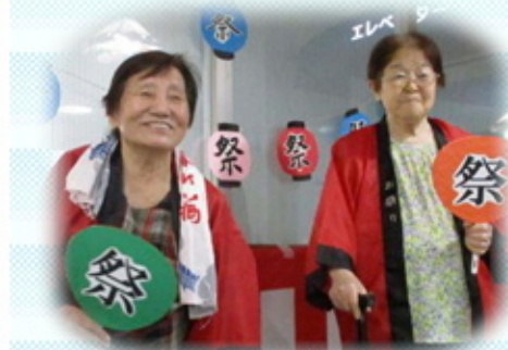
恒例の夏祭りを行いました！