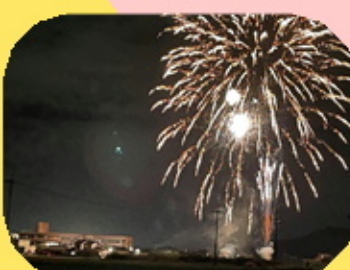
【9月22日花火が上がりました ご入居者の皆様に施設から 見ていただきました】