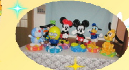
バルーンアートが得意な職員が作りました。 ご利用者様だけでなく私達も驚きました。

今年の夏は酷暑でしたね…。皆様、体調にお変わりございませんか？秋風や虫の声に少しずつ秋の気配を感じられる日が増えてきました。季節の変わり目は心身の体調に変化が出やすいものです。食事や少しの運動を通じて季節の変化を楽しむと共に、体調管理して行きましょう。