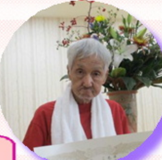
今年は百寿の方が2名いらっしゃいました！ 皆様のご長寿とご多幸をお祈りいたします